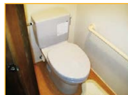
和式便器を洋式便器へ変更