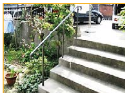
アプローチ手すり